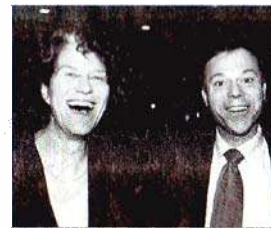
Das schafft nur das Fernsehen: Ruth Genner , Christoph Mörgeli