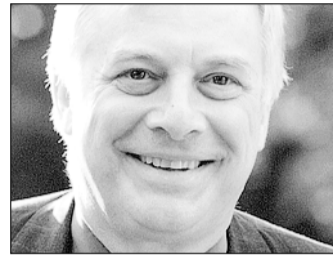
Le futur Président de la BBC devra veiller à l'indépendance et à la qualité du service public.

Comment s'attaquer à ces déséquilibres mondiaux?