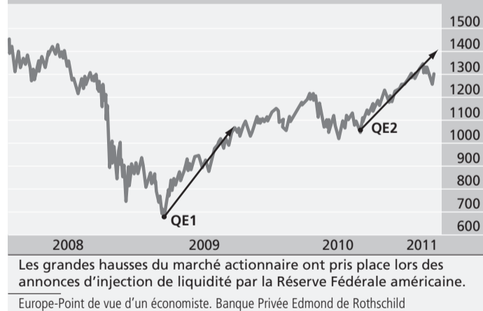
ÉVOLUTION DU S&P500 DEPUIS LE 1 er JANVIER 2008

ficultés de l'Europe ne sont pas plus graves que celles des autres et, au moins, l'Europe a entrepris de s'attaquer à ses problèmes (l'Agefi du 25 mars). Les investisseurs ont-ils moins peur de l'Europe que des difficultés sur les marchés émergents? C'est ce qui avait été observé en février. La crise portugaise est-elle déjà anticipée par les marchés? Une correction est inutile si les prix reflètent déjà cette anticipation ( lire page 11 ).